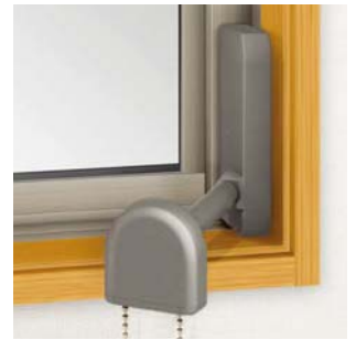
チェーン式オペレーター

吹き抜けなど、手の届かない離れた場所でも簡単なチェーン操作で窓を開閉することができます。