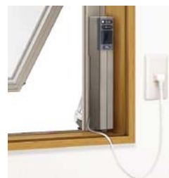
電動ユニット本体