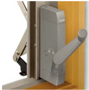
オペレーターハンドル

キッチンのシンク前の窓として使用する時も、ラクに操作できます。 (内観右側標準)